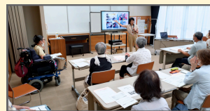
（並木地域ケアプラザ）