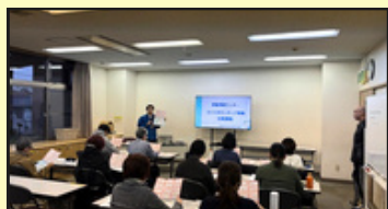
（いきいきセンター金沢）

ガイドヘルパーとは、障がいのある方が安全に外出できるようにサポートする専門職です。