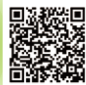
ひきこもりかなと思ったら…