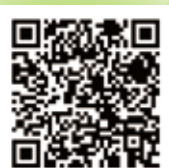
ひきこもりについて

金沢区の年齢層別の人口 若年：約45,760人 中高年：約66,340人 [令和5年1月1日現在の区別・年齢層別の人口参考]