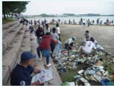
昨年9月に行われた野島海岸の清掃活動の様子