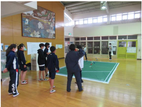
【並木中学校「ボッチャ体験」】