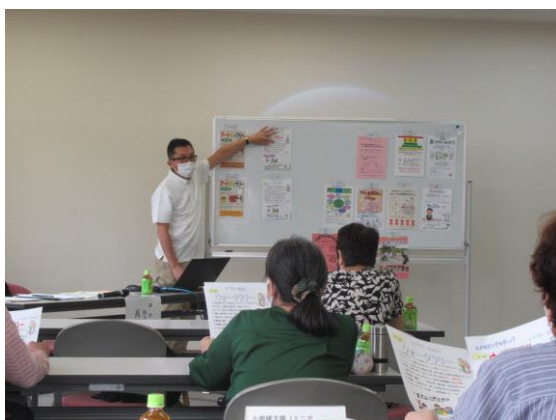
【講義:「人の集まるチラシ作り」】