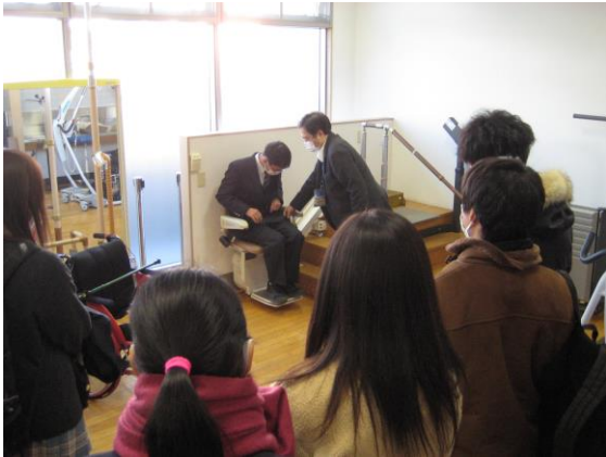
【金沢総合高校「いきいきセンター金沢見学」】