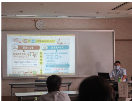
【講義:【台風・豪雨災害への備え】】