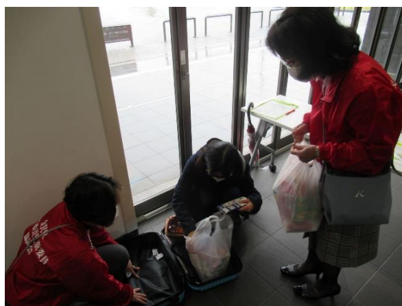
〈詰めるのを見守る民生委員の方々〉