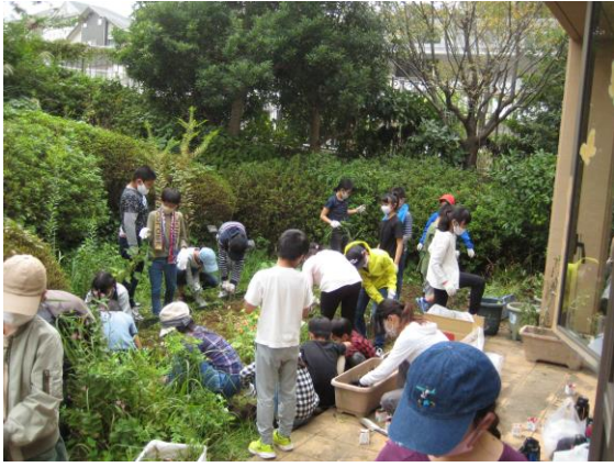
【六浦小学校「草むしり活動」】