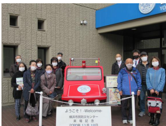
【活動視察「横浜市民防災センター」】