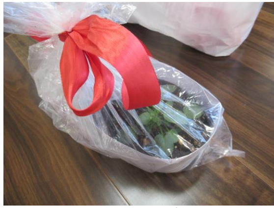
【六浦小学校「フラワープロジェクト」】