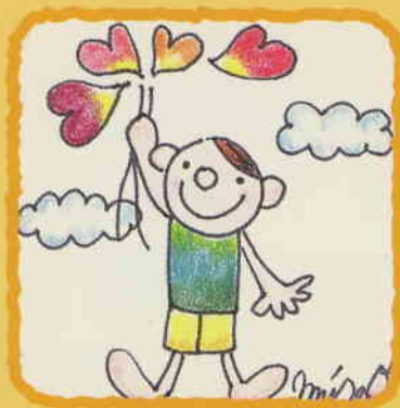
表紙イラスト：鈴木美砂緒さん みさお