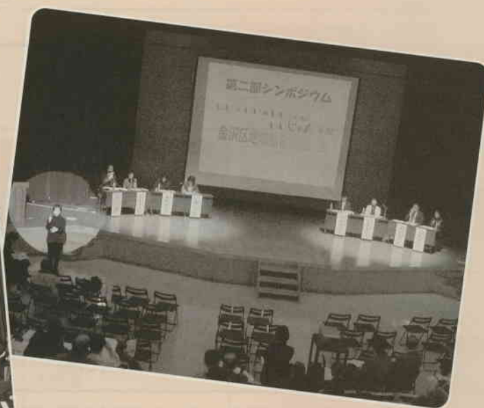
▲金沢区福祉保健のつどい(平成17年度・2点とも)