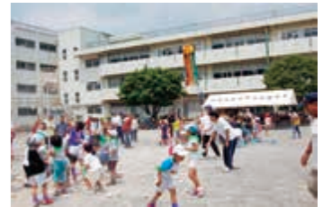
▲ 青少年健全育成行事