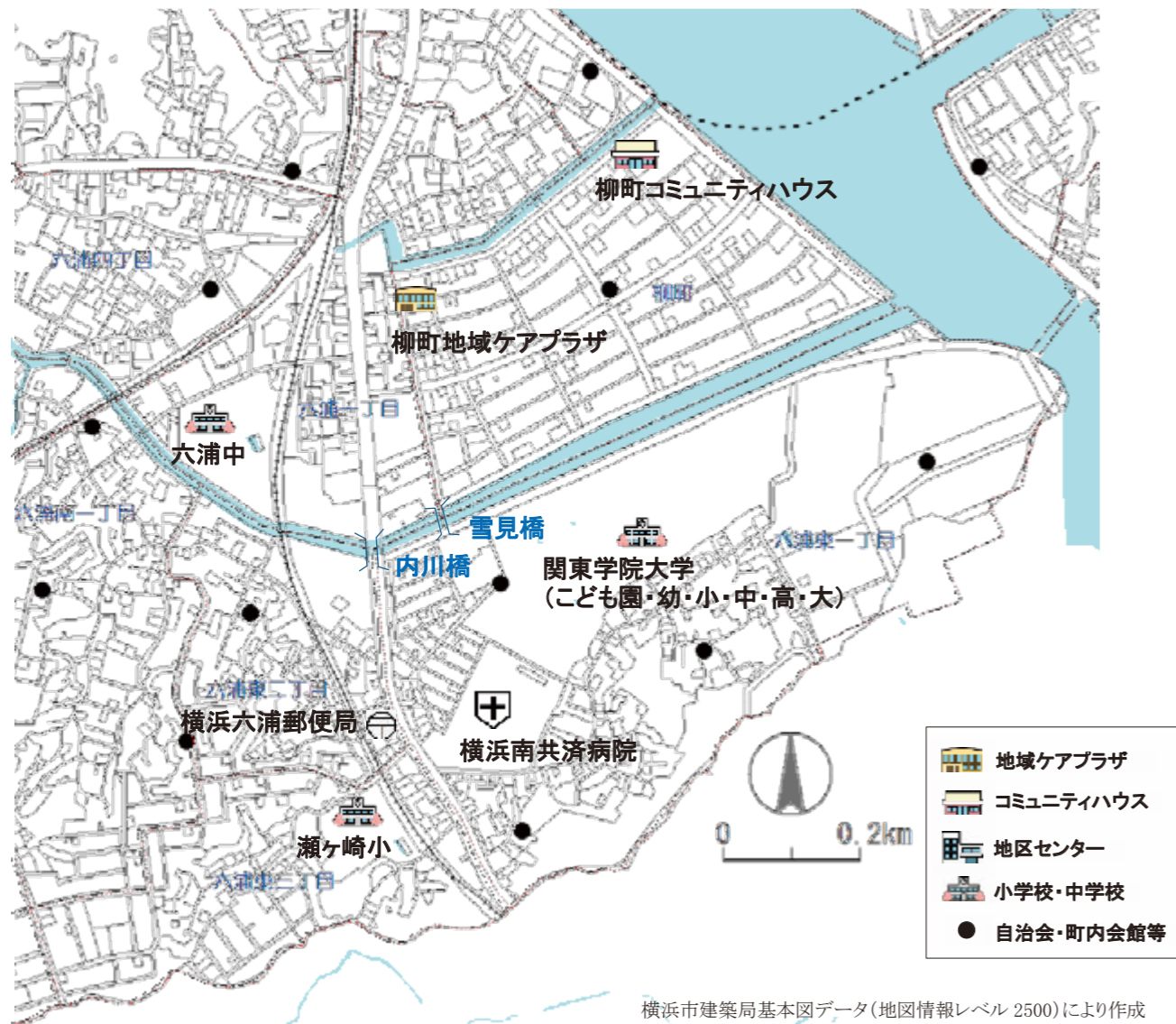
横浜市建築局基本図データ(地図情報レベル 2500)により作成