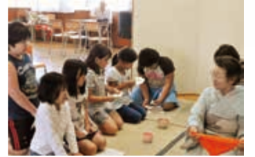
▲ 地域ふれあいまつり