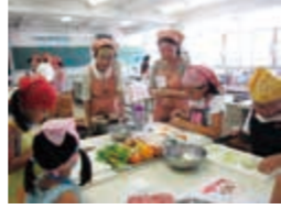
▲ 健康づくりの会（親子の食育教室）